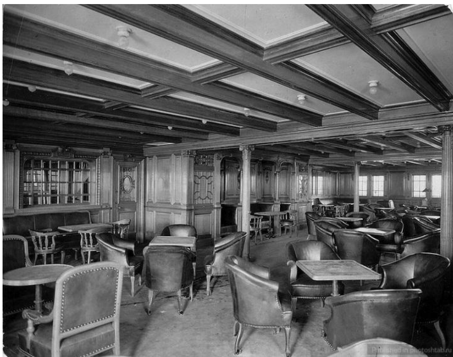
Ресторан на «Титанике», 1912 год.