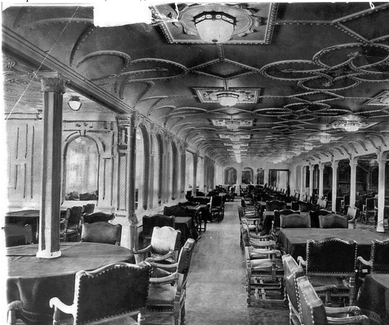
Обеденный зал на «Титанике», 1912 год.