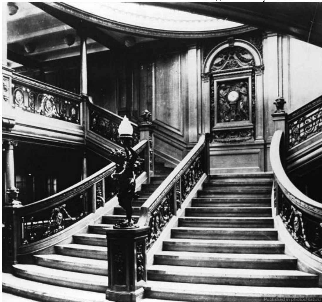
Лестница «Титаника», 1912 год. Ресторан на «Титанике», 1912 год.

Рассмотрите фотографии внутренних интерьеров «Титаника». Представьте, что вы ведёте собственный блог о мореплавателях, морских регатах и кораблях. Дайте описание интерьера «Титаника» в форме поста для вашего Блога. Ответьте на вопрос: чем будет отличаться ваше описание «Титаника» от описания «Атлантиды» И. А. Бунина?